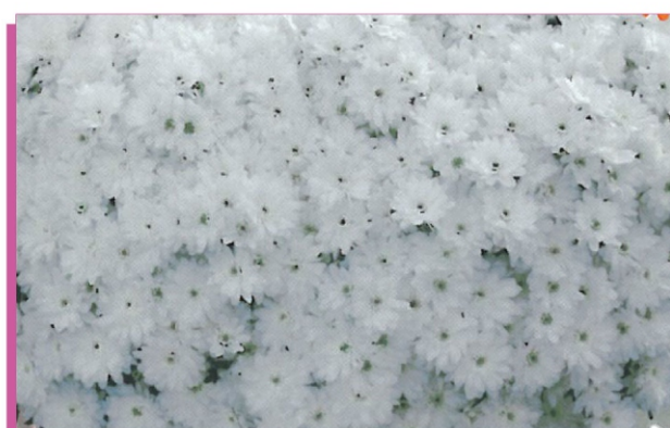
Fleur de sel