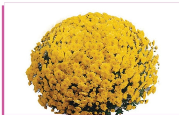
Candice Jaune Vif